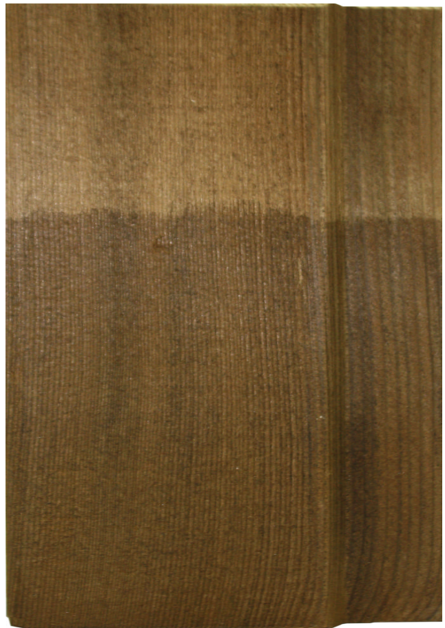
1x Arbezol Aqualin Ulme auf Druckimprägnierung, braun